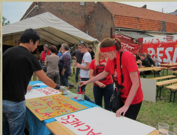
Hénin Beaumont avec les jeunes communistes