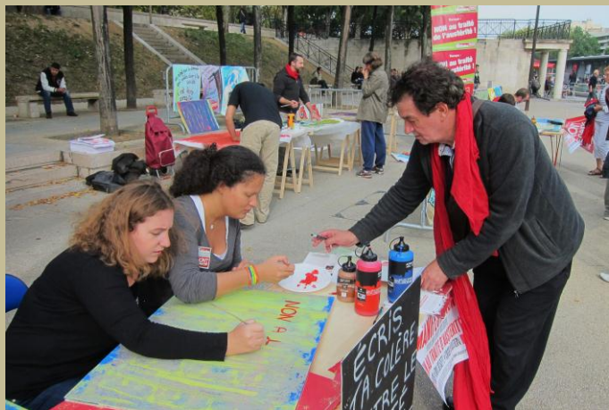
Place Stalingrad Paris public de passage

Succès garanti ! Organisez une fabrication de pancartes, de banderoles, sur la place publique en invitant les citoyennes et citoyens à créer leur pancarte, la personnaliser et défiler avec lors de la manifestation.